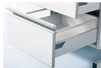
ilustrační obrázek – oboustranný laboratorní stůl (C-rám) s výlevkou, policovou nástavbou a spodními skříňkami